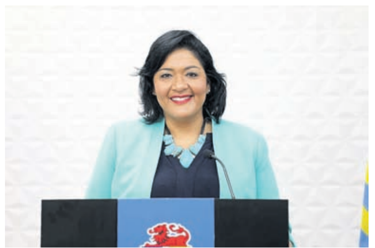
Minister Xiomara Maduro ta informa:

Desde 1 di januari ta reduci impuesto riba material di contruccion di 12% pa 10%